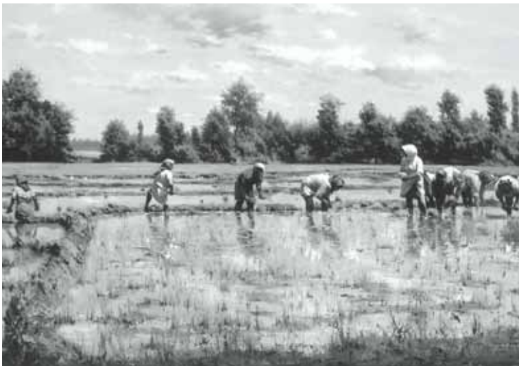
نقاشی آبرنگ از رحیم نوده‌سی

۴) درباره‌ی تصویر زیر، یک بند ادبی بنویسید.