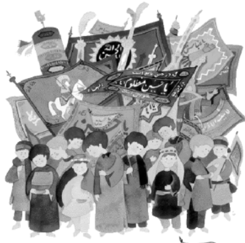
یا خود می گویم

هر وقت نام امام حسین - علیه السلام - را می شنوم، به یاد محرم می افتم.